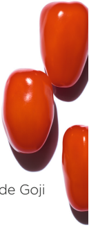
Baie de Goji